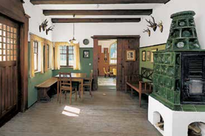
Bauernstube mit Ausstattung aus der Gründerzeit um 1908

Architektur und Dekoration dieses Raumes. Unter den wandfesten Teilen sind ein Marmorkamin so wie ein Wandbrunnen aus Marmor hervorzuheben, dessen Zentrum das Relief eines Putto mit Schwan bildet. Einzelne fehlende Teile der Ausstattung wurden ergänzt, die zugehörige Möbelgarnitur und der Lüster restauriert. Als museale Ausstattung werden im Salon zahlreiche Gemälde von Anna Sophie Gasteiger und ihre Malutensilien gezeigt. Die Künstlerin hat in ihren letzten Lebensjahren nachweislich in diesem Salon gemalt. Die hier aufgestellte, um 1900 entstandene Büste einer Bacchantin gehört zu den namhaften Werken Mathias Gasteigers aus dessen Jugendstilzeit.