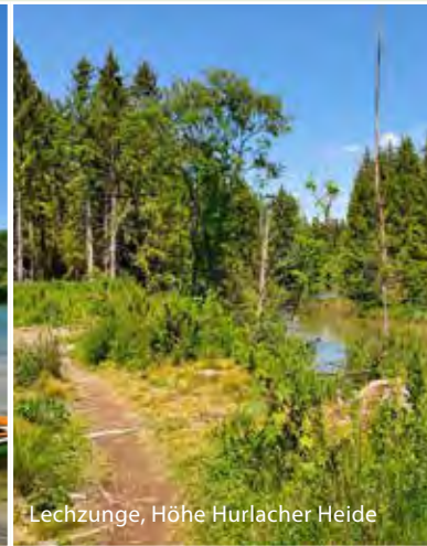
Lechzunge, Höhe Hurlacher Heide